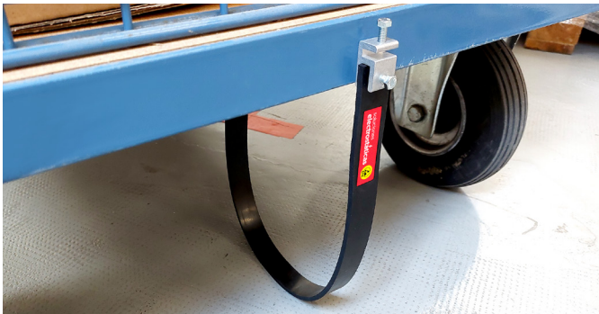
Ejemplo de instalación A en carro