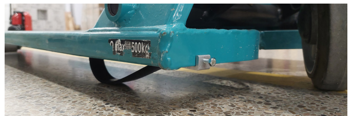
Ejemplo de instalación B.2 en transpaleta. Es preferible la instalación oculta (segunda imagen) para evitar tropezos del personal