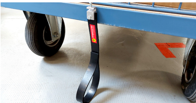
Ejemplo de instalación B.1 en carro